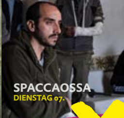
SPACCAOSSA DIENSTAG 07.