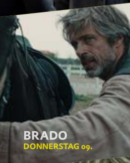
BRADO DONNERSTAG 09.