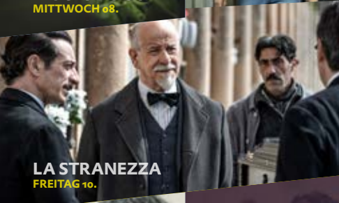
LA STRANEZZA FREITAG 10.