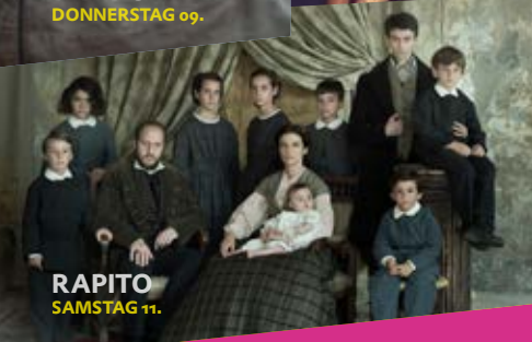
RAPITO SAMSTAG 11.