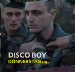
DISCO BOY DONNERSTAG 09.