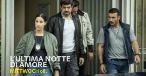
L'ULTIMA NOTTE DI AMORE MITTWOCH 08.