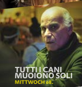
TUTTI I CANI MUOIONO SOLI MITTWOCH 08.